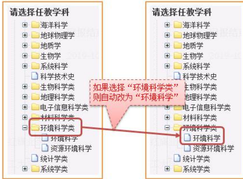
可选"任教学科" 清单及相应 "查找路径"